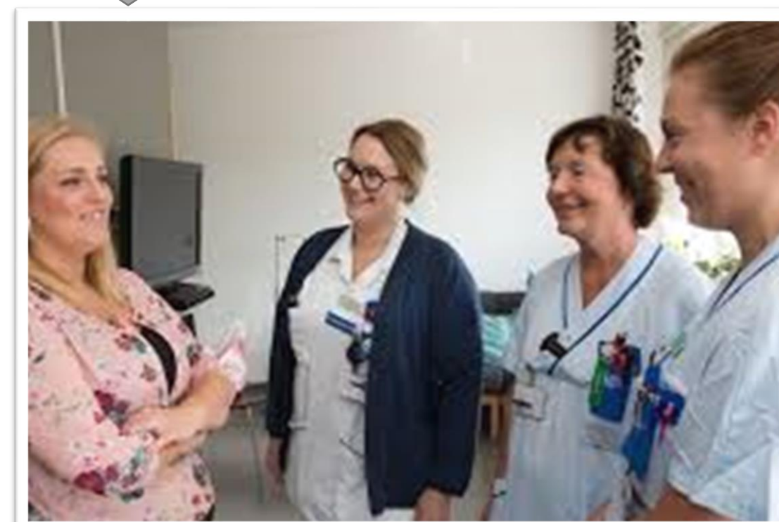
Samtal mellan peer support och vårdpersonal