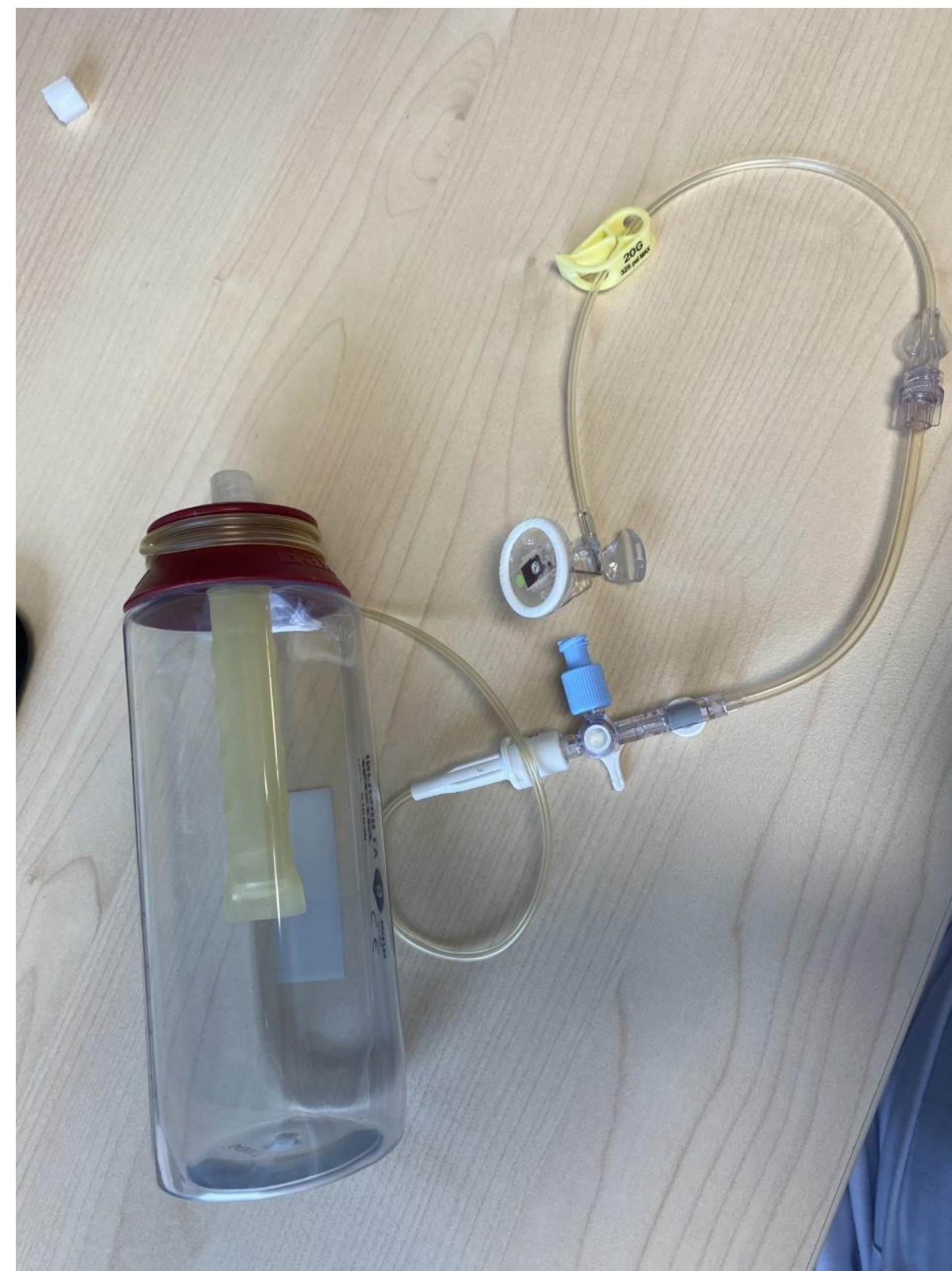
Cytostatika-pump med sin slang och portnål som sitter i patientens centrala infart

Vi erbjuder våra patienter möjligheten att själva få koppla bort sin vakuumpump i hemmet. De erbjuds då en utbildning och erhåller ett egenvårdintyg. Utbildningen minskar antalet vårdtillfällen för patienten och gör vården mer personcentrerad.